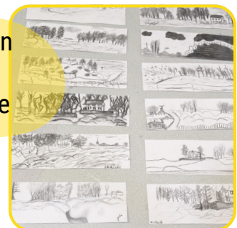
Dessins d'observation des tranchées de l'Historial de Péronne