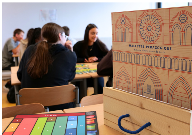
Mallette pédagogique Rebâtir Notre-Dame de Paris, Romaric Toussaint © Rebâtir Notre-Dame de Paris

Les activités invitent les jeunes à s'amuser et à réfléchir sur des sujets phares du chantier, tels que la restauration des charpentes, la planification des travaux pour garantir la réouverture en 2024 ou encore le choix de techniques de restauration.