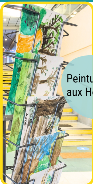
Peintures de paysage aux Hortillonnages