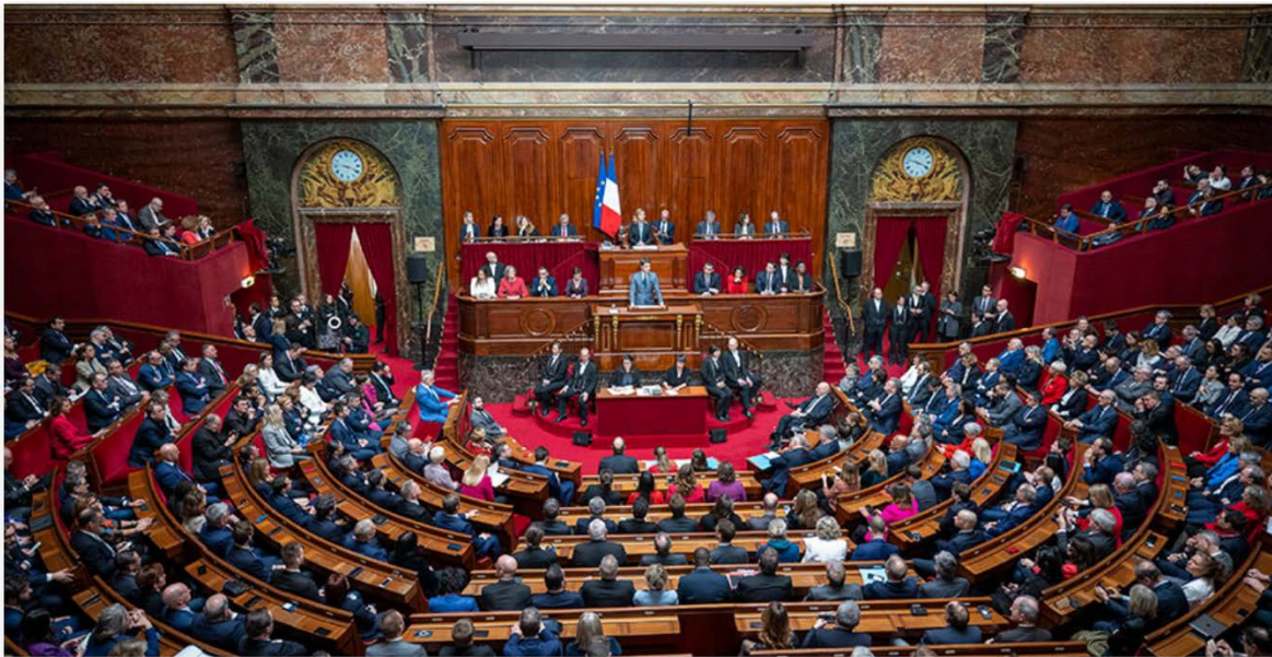
Congrès du 4 mars 2024

Il n'y a pas de « pente » naturelle favorable à l'ouverture des droits et à l'accès à l'égalité entre femmes et hommes.